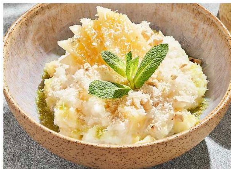
Рис с ананасом и кешью